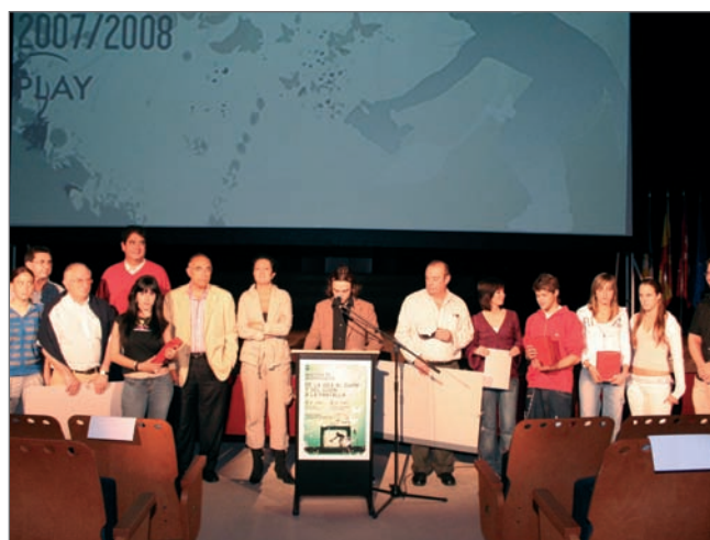
En la imagen superior, los premiados junto a la Concejalía de Cultura

Durante el curso escolar se han celebrado encuentros y charlas con profesionales del medio. Este año han participado en la Muestra alumnos de los Institutos Federico García Lorca, Carmen Conde y El Burgo de Las Rozas. En total, unos 200 alumnos, organizados en grupos que han presentado 9 audiovisuales.