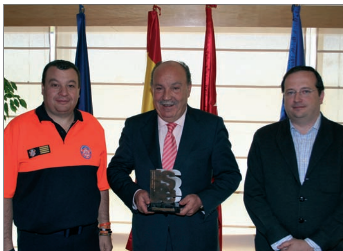
En la imagen, el Jefe de SAMER-Protección Civil, el Alcalde roceño y el Concejale de Seguridad y Protección Ciudadana

Entre los acontecimientos más sobresalientes en los que ha participado destacan los trabajos de reconstrucción tras el huracán Mitch, el terremoto de Turquía o el maremoto de Sri Lanka, la inundación del camping "Las Nieves", en Biescas (Huesca) y, muy especialmente, en el atentado del 11 de marzo en Madrid.