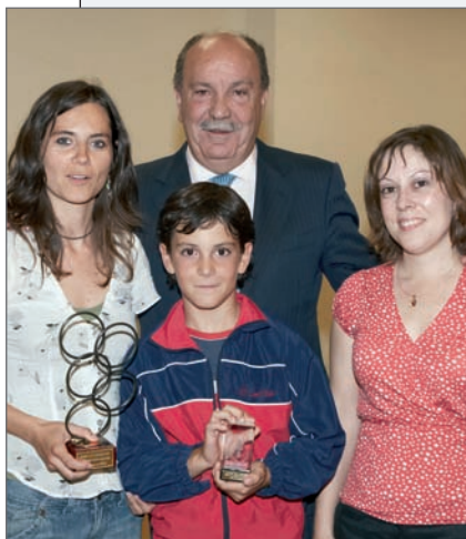
En la imagen, el Alcalde de Las Rozas junto a algunos de los galardonados