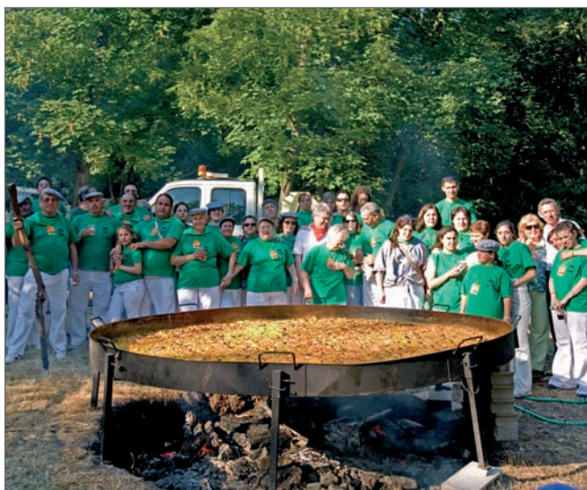
En la imagen, la delegación roceña y miembros de la Corporación de Villebon junto a la paella popular

A comienzos de junio, una delegación de Las Rozas visitó Villebon sur Yvette con motivo de la celebración de la tradicional fiesta campestre "Guinguettes" que suele tener lugar a orillas del río Yvette y que marca el inicio del verano .