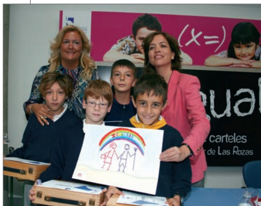
Junto a estas líneas, la Directora General de la Mujer y la Concejala de Atención Social e Integración

En esta primera edición han participado 200 alumnos del 2º Ciclo de Primaria de tres colegios de Las Rozas: Vicente Aleixandre, El Cantizal y Siglo XXI, organizados en grupos de 3 ó 4 y que durante varias semanas han reflexionado, desde un enfoque lúdico, sobre el valor de la igualdad, trabajando con cuentacuentos y talleres de plástica. Por su parte, el C.P. Vicente Aleixandre lograron el 1º y 2º finalista y el C.P. Siglo XXI el 3º finalista.