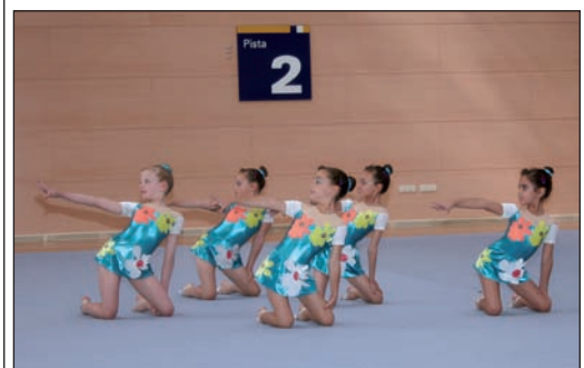
En la imagen, una exhibición de alumnas de la Escuela Municipal de Gimnasia Artística

Las listas de nuevos admitidos se podrán consultar del 1 al 14 de septiembre en cualquiera de los Centros Polideportivos o en la página web. Una vez admitidos deberán matricularse para poder iniciar las clases en las fechas arriba indicadas. Les recordamos, la forma de pago de los trimestres sólo será por domiciliación bancaria.