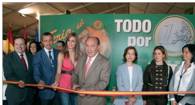
En la imagen superior, el Acto de Inauguración de la Feria, junto a estas líneas, el Alcalde saludando en uno de los stands

Además, varias pantallas de televisión entretuvieron a los visitantes que pudieron seguir acontecimientos deportivos como los partidos de la Eurocopa de Fútbol y la final del torneo Roland Garros de tenis .