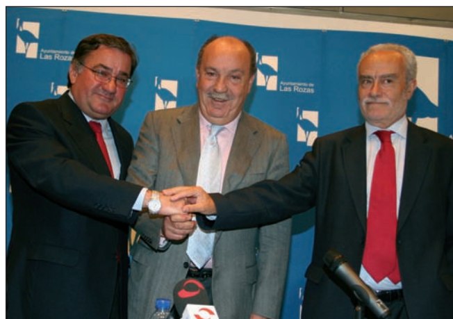
De izquierda a derecha, el Presidente de Unipublic, el Alcalde de Las Rozas y el Director General de la Vuelta Ciclista a España tras la firma del convenio

La Vuelta a España llegará a 200 millones de personas en 80 países de todo el mundo.