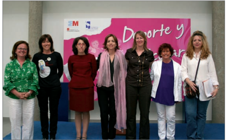
En el centro, la Concejala de Atención Social e Integración junto a las representantes de las AMPAS firmantes

Este programa comenzará a desarrollarse a partir del próximo curso escolar y supondrá una ampliación y refuerzo de las actividades extraescolares con el objetivo de propiciar la permanencia tanto de los alumnos más desfavorecidos como de los inmigrantes en los centros, evitan-