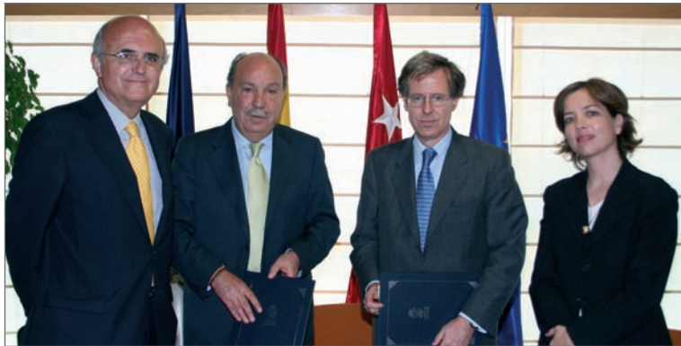
De izquierda a derecha, el Concejal de Menor y Familia, el Alcalde de Las Rozas, el Decano del Ilustre Colegio de Abogados de Madrid y la Concejal de Atención Social e Integración

Podrán beneficiarse distintos colectivos; la atención jurídica únicamente se prestará a aquellos casos derivados a través del personal de Atención Social Primaria de de las dos concejalías que acogen este servicio.