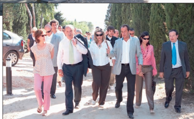
En la imagen superior, las instalaciones destinadas a dormitorios; en la imagen inferior, la visita oficial a las instalaciones

Coincidiendo con la inauguración de la Finca "El Pilar", se celebró la clausura de los XXV Juegos Municipales, que este año han contado con la participación de 7.500 personas. Este año los Juegos Municipales han estado formados por siete disciplinas: fútbol, fútbol-sala, voley, voley-playa, padel, tenis y baloncesto.