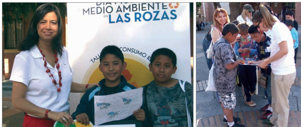
En la imagen, la Concejala junto a los ganadores; a la derecha, un momento del desarrollo de los juegos

Además, del 15 al 19 de junio, la Concejalía desarrolló una Campaña de concienciación ciudadana sobre la importancia de la separación de residuos en origen, especialmente en el caso de plásticos, envases y bricks.