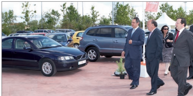
En la imagen superior, el Alcalde de Las Rozas y el Concejal de Fiestas y Ferias junto al Director de la Feria. Junto a estas líneas, una vista general del Recinto durante la Feria

En la 1ª Edición se vendieron más de 120 coches en 5 días, y en esta ocasión, a pesar de las lluvias, las ventas también han sido satisfactorias. Además, hubo Parque Infantil para el disfrute de los más pequeños y una exposición organizada por la Asociación Española de Clásicos deportivos que realizó un raid por las calles de Las Rozas .