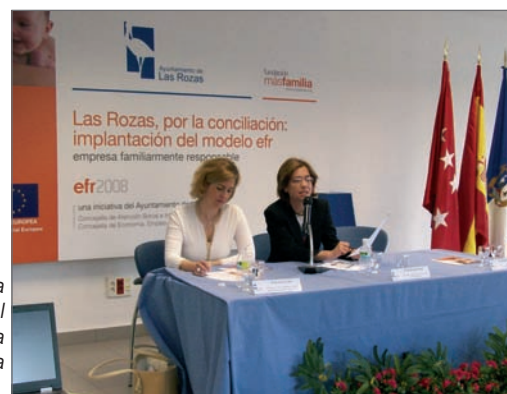
En la imagen derecha, la Concejala de Atención Social y a su derecha, la Concejala de Economía

El EFR implica un modelo de gestión empresarial, que sin renunciar a la competitividad y la rentabilidad recoge medidas a favor de la conciliación, tales como flexibilidad horaria, ampliación de permisos de paternidad/maternidad, permisos especiales para el cuidado de los hijos y/o personas dependientes, guarderías en la empresas, excepciones, etc.